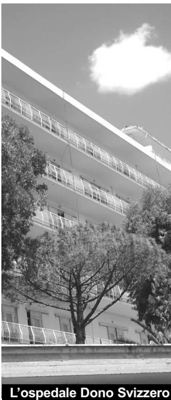
L'ospedale Dono Svizzero

Ancora una volta un episodio non più di malasanità a Formia, ma di sanità vergognosamente in agonia. Vissuto da me ed alcuni parenti in prima persona e non per sentito dire o letto. Accompagniamo ieri sera al Dono Svizzero di Formia un'anziana zia in preda a forti dolori addominali con vomito ormai da 24 ore. Dopo averle somministrato senza risultato positivo più volte un farmaco prescritto dal medico di famiglia e dopo essere stata visitata dalla guardia medica, decidiamo il trasporto presso il presidio ospedaliero formiano verso le 20. Qui la prima grande sorpresa. Una fila interminabile al pronto soccorso. Ci dicono che i tempi di attesa sarebbero stati molto lunghi. Anche qualche ora. Si fa presente al personale di turno il proble-